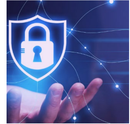
Sicurezza dell'informazione, Cybersecurity e Protezione Privacy