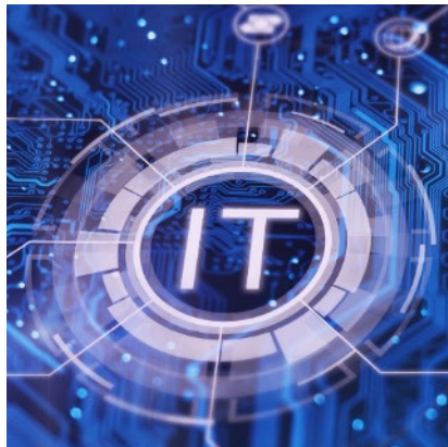
Gestione dei servizi IT