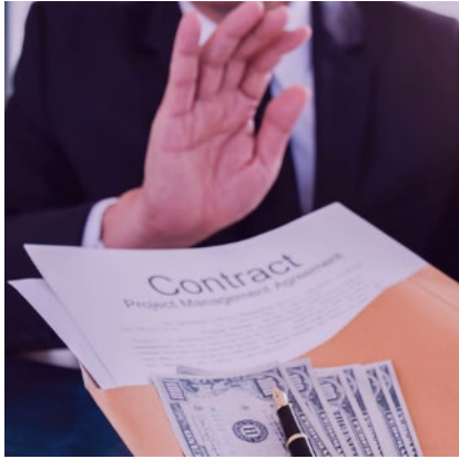
Prevenzione della corruzione